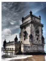
Portugal : la Tour de Belem. Avant le tremblement de terre de Lisbonne en 1755, elle se trouvait au centre du Tage. Depuis, le fleuve ayant changé son cours, elle est sur la berge.