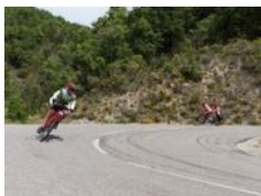
Descente col de Lescou, 819 m. (Drôme)